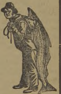
Nenhuma é legitima sem esta marca.