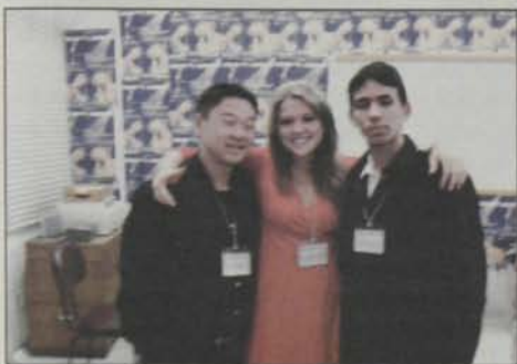
Os Diretores do CAOC, Flavinho90, Aline93 e Saul94, organizam os últimos detalhes para a Festa.

Resurgindo e inovando neste ano, a Festa do Esqueleto mostrou porque é uma das melhores festas do circuito universitário. Após décadas de muito folclore e tradição, a edição desta gloriosa festa contou com a valorosa participação das Comissões de Formatura da FMUSP, para garantir que o público não ficasse de mãos vazias em nenhum momento. O frio não foi problema para que mais de 1300 pessoas pulassem e cantassem ao som da banda MATRAKA LOKA, do DJ TORRADA (Metropolitana FM) e DJ LUCKY (Energia 97 FM). Tudo leva a crer que a próxima edição promete ser a festa mais insana que os estudantes universitários de São Paulo irão presenciar! E a festa será totalmente NOSSA, alunos da FMUSP!!!