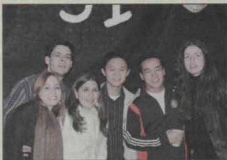
Os membros da Comissão de Formatura (C.F.) da Turma 91 aproveitam a Festa do Esqueleto.