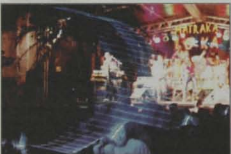
Laser cria uma atmosfera inovadora no show da banda Matraka Loka .