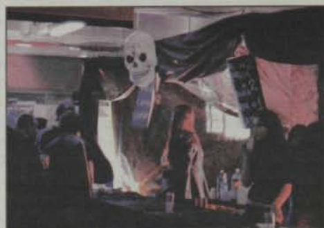
A C.F. da Turma 93 ajuda na organização da Festa.