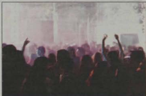
Mais de 1300 pessoas lotam os ambientes da Festa do Esqueleto.

PÚBLICO PULA, CANTA E DANÇA DURANTE O SHOW DA BANDA MATRAKA LOKA.