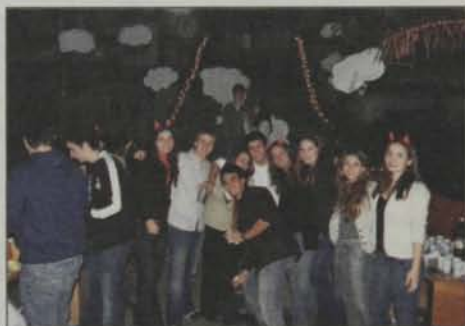
Estudantes da FMUSP se reúnem para tirar a foto na barraca da C.F. da Turma 94, que ficou em uma das duas praças externas do CAOC.