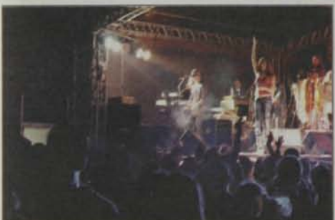
A banda Matraka Loka agita o público da Festa.