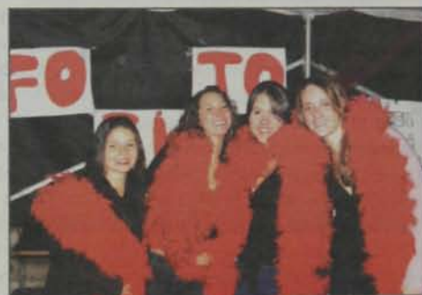
Alunas da FoFITO também participam da Festa, em barraca intitulada "Cabaret da FoFITO".