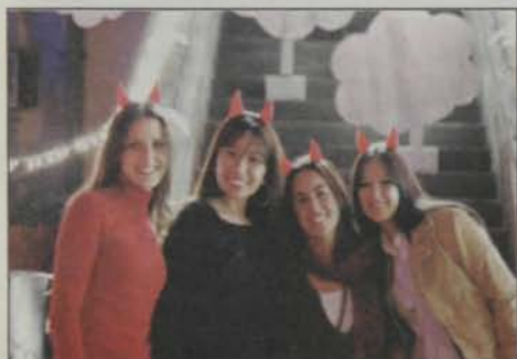
Alunas e membros da C.F. da Turma 94 promovem o tema de sua barraca: Inferinho 94 .