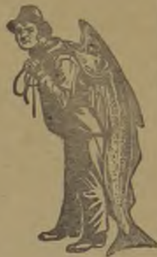
Nenhuma é legitima sem esta marca.