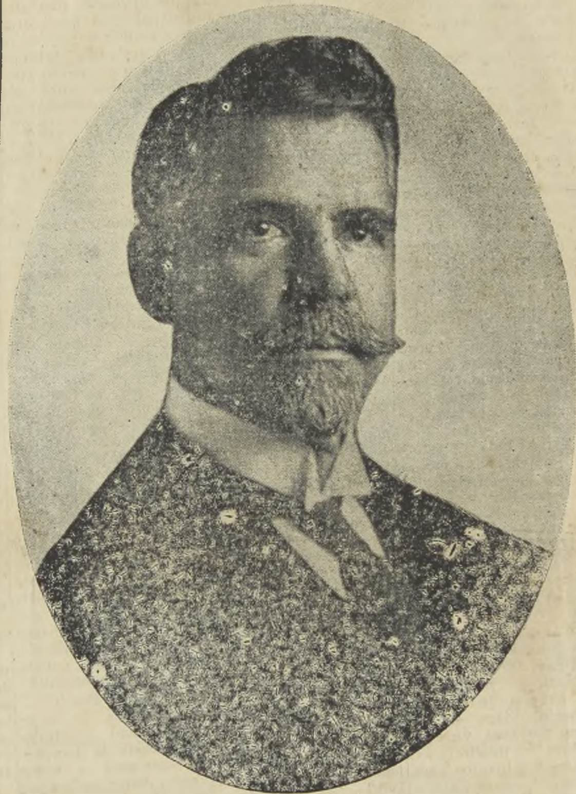
Dr. Washington Luis Presidente da Republica

A politica è a sciencia do dynamismo social. Os politicos brasileiros sem-