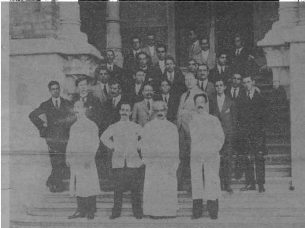
1913 — Da esquerda para a direita, de avental: Artur Neiva, Carlos Chagas, Oswaldo Cruz e Adolfo Lutz. Atrás, a diretoria do CAOC e alunos da FMUSP.

“Éramos todos ouvidos, quando ele começou a falar.