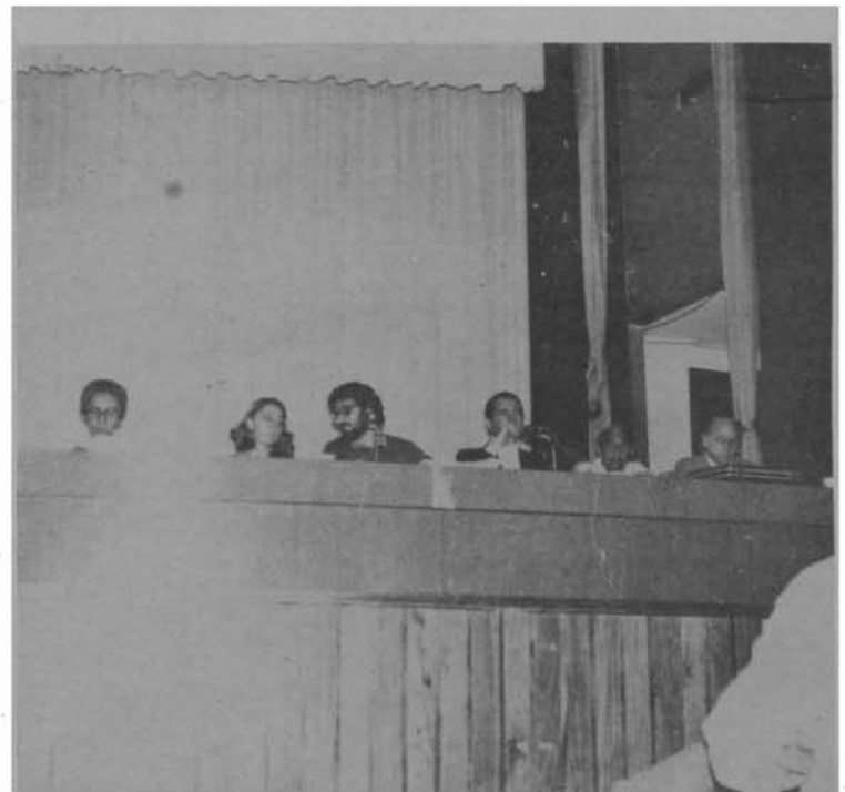
Forum da FMUSP

Deve ser determinada, a partir da especificação desse objetivo, em cada etapa, qual a contribuição de cada disciplina na formação geral . Essa definição, em cada etapa do curso